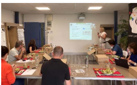
Atelier déjeuner/participatif avec les adhérents afin de préparer les Rencontres Numériques Pays Basque 2020

Cette 11 e édition abordera donc pendant une journée, les solutions numériques d'avenir plus accessibles, plus propres et plus durables . Les ateliers et tables rondes traiteront par exemple de l'accessibilité web, du numérique qui enrichit la solidarité. On examinera aussi, comment mieux choisir son matériel technologique, ses logiciels, ses e-services pour diminuer les forts impacts sur nous-même et la planète. Et un temps fort sera consacré à l'open data et les biens communs numériques qui valorisent durablement les territoires.