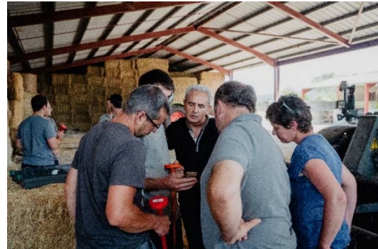
Visite d'une « ferme numérique » à Bunus, pour les Rencontres Numériques Pays Basque 2019

Habituellement organisées début juillet, les Rencontres Numériques ont été reprogrammées, en raison du calendrier électoral et de la situation sanitaire. L'ensemble du programme et des modalités d'inscription sera dévoilé début septembre. Cet événement est gratuit et sera pour la 1ère fois retransmis en direct sur une Web TV dédiée. Il est à présent possible de s'inscrire pour être averti en avant-première de l'ouverture des inscriptions et du programme détaillé sur : www.antic-paysbasque.com