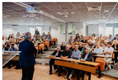
Conférence d'introduction des Rencontres Numériques 2019 par Alain Lamassoure, ancien député européen