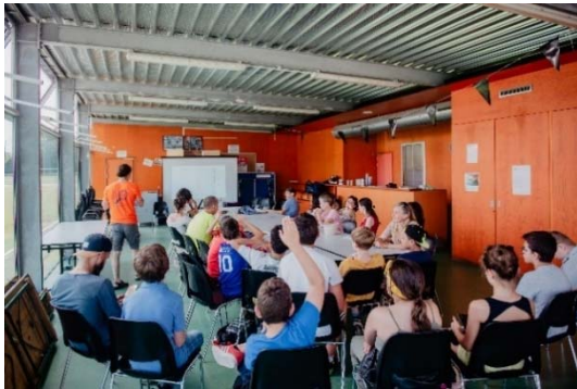
Cartopartie organisée par Teritorio à l'occasion des Rencontres Numériques Pays Basque 2019